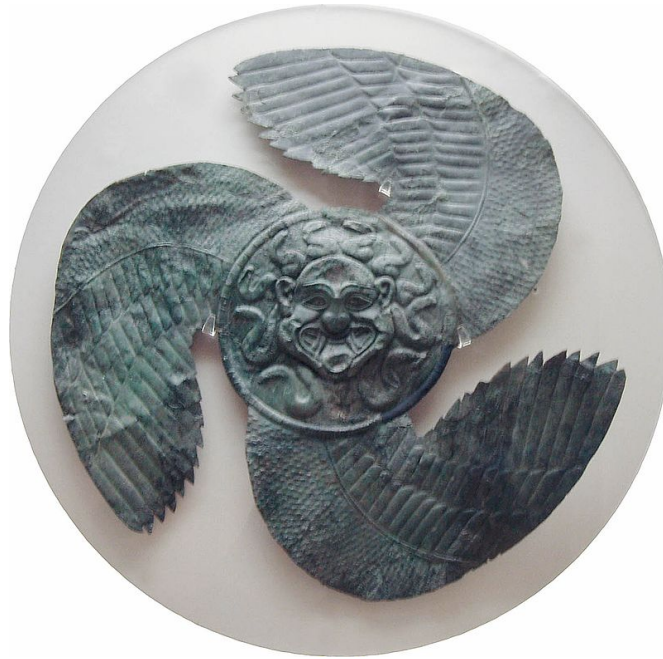
Figur 1: Udsøgt bevinget gorgonia fra Olympia museet i det vestlige Peloponnese.

Templet udsmykket med gorgonia og gorgonia bæres gerne som medaljer af de forsamlede. Dette for at skræmme ondsindede kræfter væk. Under måltidet gives der flere bønner og taksigelser til Athena, Hefaistos og Prometheus. Dele af Perseus fortællingen reciteres gerne. Herefter udføres en ceremoni som kun er trossamfundets medlemmer bekendt. Denne afsluttes med et vinoffer og en bøn. Måltidet afsluttes med et vinoffer og igen gerne afbrænding af rester, hvis dette tillades.